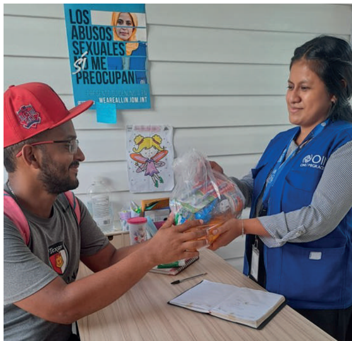
ASISTENCIA HUMANITARIA © OIM OCTUBRE 2023

Paralelamente, se ha realizado una donación de más de 1,100 kits de refacción e higiene a las representaciones diplomáticas en el país de Honduras, El Salvador y Ecuador. Esto con el objetivo de fortalecer el trabajo conjunto y apoyar a sus connacionales que se encuentran en situación de vulnerabilidad transitando por Guatemala.