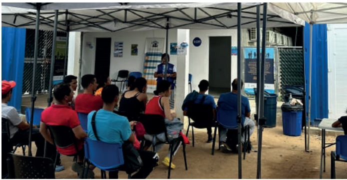
BENEFICIARIOS DE PROGRAMAS © OIM OCTUBRE 2023

Reunificación familiar y retorno voluntario: Los bloqueos y protestas generalizadas en el país afectaron a los potenciales beneficiarios de servicios de reunificación familiar (en su mayoría provenientes de Huehuetenango), dado que no pudieron movilizarse hacia los centros de atención de OIM. Aun así, 39 personas migrantes fueron asistidas con servicios de reunificación familiar, retorno voluntario asistido y reasentamiento. Los servicios prestados incluyen transporte, noches de hospedaje, alimentación, atenciones médicas, entre otras. Adicionalmente, se apoyó a 27 personas con la gestión de citas y costos asociados para obtener sus pasaportes, requisito previo a la solicitud de servicios de reunificación familiar.