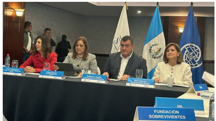
COMISIÓN INSTITUCIONAL CONTRA LA TRATA DE PERSONAS © OIM OCTUBRE 2023

Adicionalmente, la OIM brindó apoyo técnico para la validación del borrador de la política en las subcomisiones de la CIT en realizando tres talleres técnicos sobre (i) Prevención y Fortalecimiento Institucional; (ii) Detección, Atención, Protección y Repatriación; y la (iii) Persecución y Sanción.