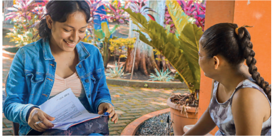
PARTICIPANTES DE PROGRAMAS DE BECAS OCTUBRE 2023