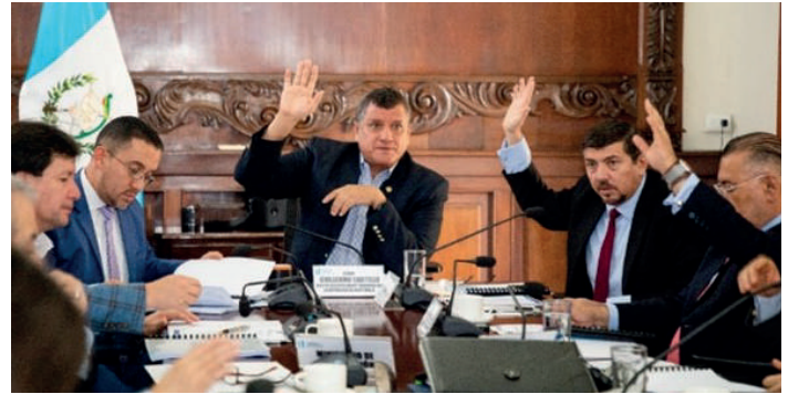
APROBACIÓN DE POLÍTICA MIGRATORIA

Apoyo a la actualización de la política contra la trata: El 19 de octubre tuvo lugar la reunión ordinaria de la Comisión Interinstitucional contra la Trata de personas (CIT) liderada por el vicepresidente Castillo acompañado por la vicepresidenta electa Karin Herrera, y realizada por la Secretaría contra la Violencia Sexual, Explotación y Trata de Personas (SVET), con el apoyo técnico de la OIM. En dicha reunión se le dio seguimiento al proceso de actualización de la Política Pública contra la Trata de Personas y Protección Integral a Víctimas, así como a las recomendaciones emitidas por el Departamento de Estado de los Estados Unidos.