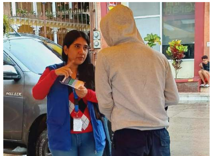
PERSONAL DE OIM BRINDANDO INFORMACIÓN A POBLACIÓN MIGRANTE EN TRÁNSITO

La OIM, en colaboración con UNICEF, desarrolló mensajes clave para la población migrante que se encuentra en Esquipulas. Estos mensajes serán difundidos próximamente por emisiones de radio y canales de comunicación de UNICEF. Mientras tanto, los encuestadores del equipo DTM de la OIM ya utilizan un guion de información para informar a las personas migrantes sobre sus derechos, los riesgos de la migración irregular y los servicios disponibles en Esquipulas y en Guatemala.